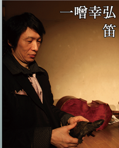
ニーチェさんですよ